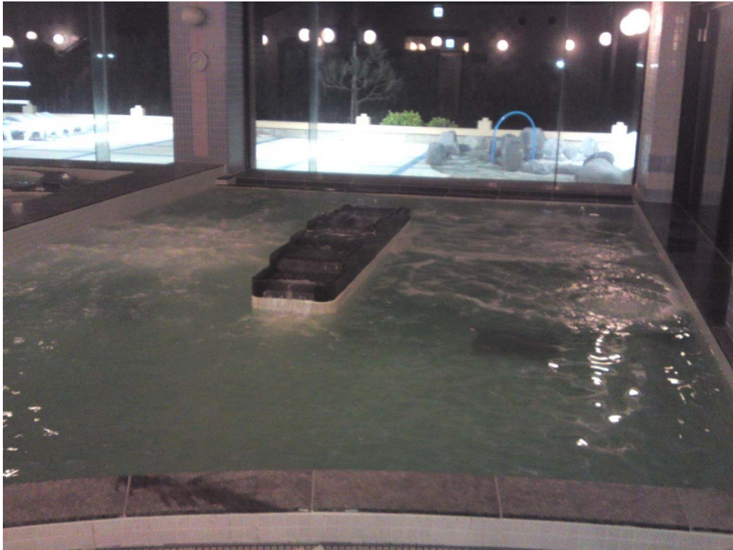
【ハーブ浴のジャグジー稼働状況を確認しました H26.3.27 (木)】