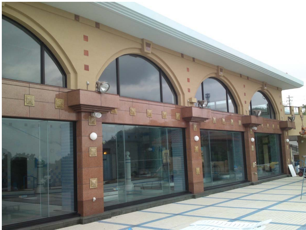
【外壁（南面）の補修を完了しました H26.3.26 (水)】