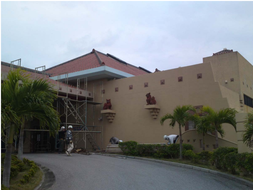
【玄関回り外装塗装処理を施しました。H26.3.3（月）】