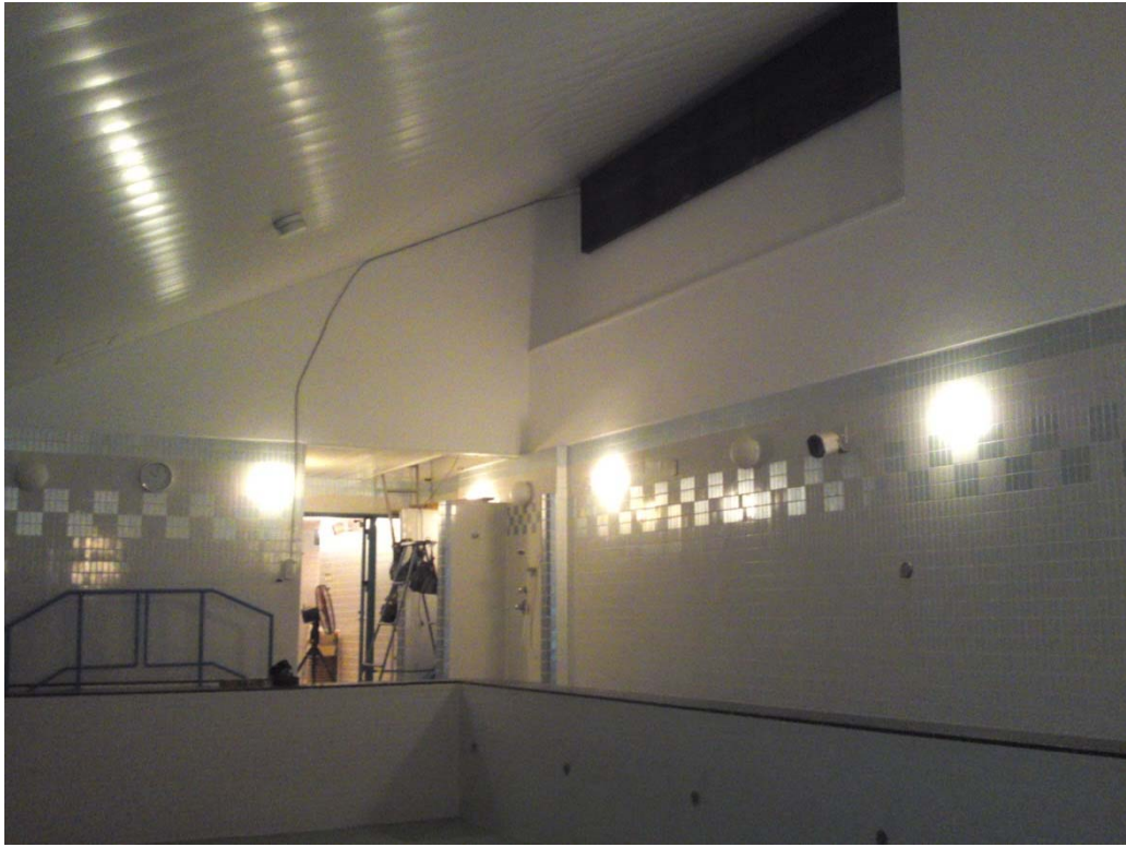
【3F リラクゼーションプールの天井・壁補修を完了しました。H26.3.27（木）】