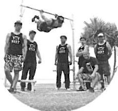
ストリートワークアウト沖縄