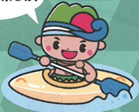
宜野座村キャラクター 「ぎへのくん」