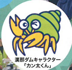
漢那ダムキャラクター 「カン太くん」