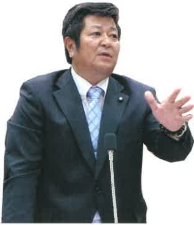
新里 文彦 議員

特別な支援を要する園児が、預かり保育を希望した場合幼稚園での預かりは、安全面を考慮し対応していない状況であり、村内にある児童デイサービスの施設が利用できるように、調整、対応、相談などを行っているところである。