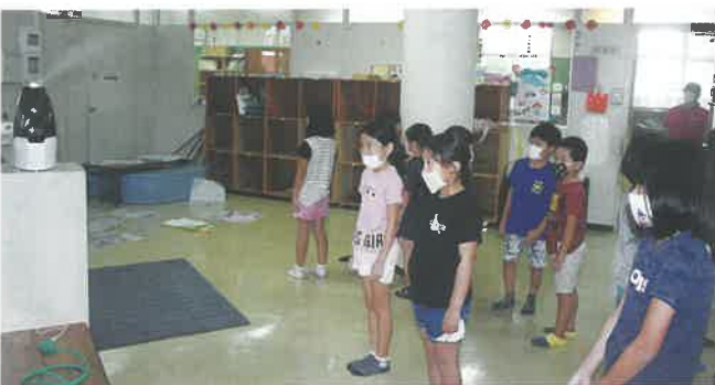
各児童クラブでもマスクと次亜塩素酸水で予防対策