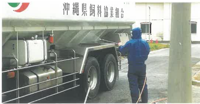
豚糞(CSF)終息に向けて

村内の畜産農家も数に限りがあり、原料も限られていると思う。現在、豚糞(CSF)の問題がある。そういった問題も加味しながら総合的に対応していきたい。