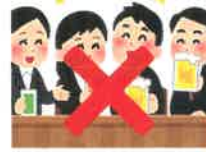
飲食目的の懇親会