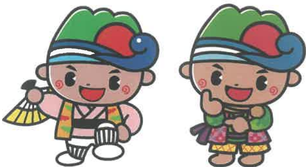
京太郎(チョンドラー)を踊るぎーのくん