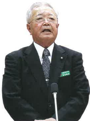
當眞 嗣則 議員

育成センターは平成12年度の開所以来農業後継者などの確保、育成を目的に作付けから肥培管理、収穫、出荷作業の実践的な研修はもとより、研修終了後の農業経営がスムーズに取り組めるよう経営や栽培計画のプランづくり、また経営者としての自覚や責任に対する教育、自立に向けた取り組みに力を入れている。