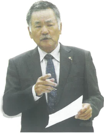
小渡 久和 議員

北部12市町村長による沖繩担当大臣への要請行動の際に、関係首長に北部地域ダム協議会の開催を呼びかけたが、理解は示すものの開催には至っていない。令和2年度は新型コロナウイルス感染症の影響により協議することが