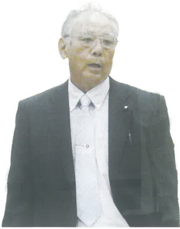
平田 嗣義 議員

令和2年4月の段階では正規の保健師二人が産休育休のため厳しいと、この二人が9月と10月に戻ってきて体制が整った。やはり高齢者の医療費とか、介護給付費の適正化だったり健康寿命の延伸だったり早くスタートしたほうがより良いということ、みんな協力してやって行こうとなった。