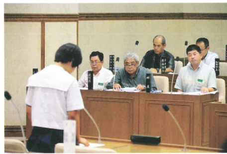
第1回子ども議会の様子 (第2回は令和3年11月予定)