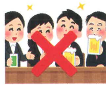
飲食目的の懇親会