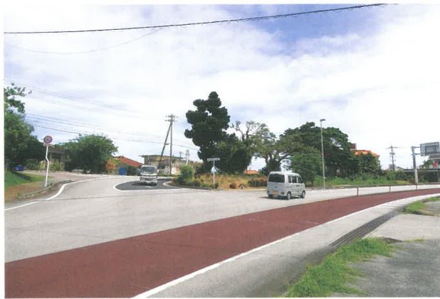
交通量増により危険視される交差点(松田区)

た後に、区から再度の要望がない状況であるため、その後、村から信号機設置の要望は行っていない。 なお、当該エリアについては過去にも何度か交通事故が発生するなど、松田区からは国道の線形修正を求める要望があり、北部国道事務所へは毎年区の要望をお伝えしている状況である。 今後の対応としては、国道事務所と協議をしながら、注意喚起ができる標識や看板の設置などの