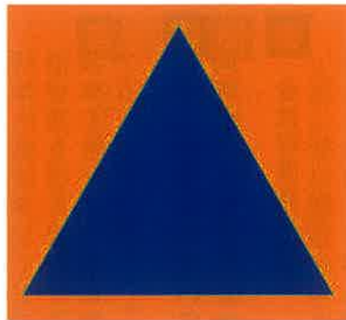
○特殊標章 このマークは、国民の保護のための措置を行う人や車両等を識別するための国際的な標章です。

答 村長 近隣市町村のレベルではないと思っており、現実的には難しい問題が多々ある。全県的な取り組みとして考えたい。