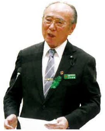
やまうち しょうけい 議員 山内 昌慶