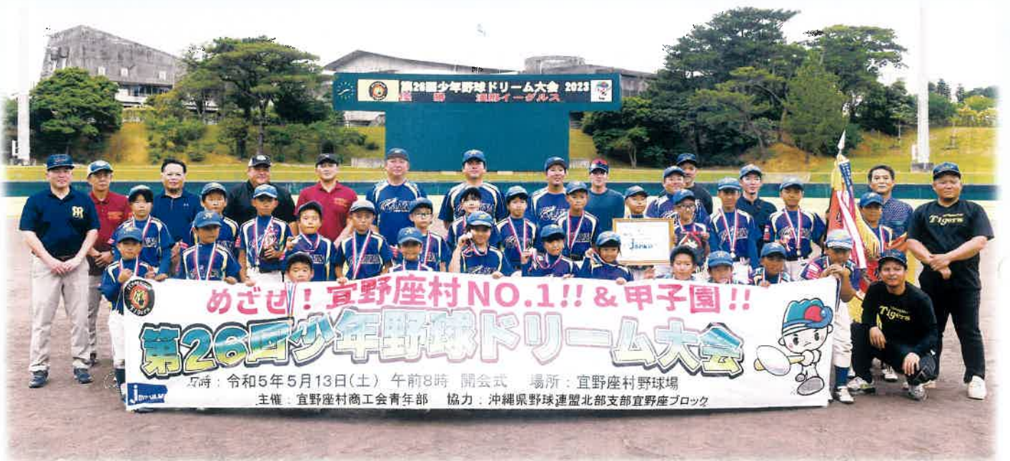
第26回ドリーム大会(漢那イーグルス優勝)