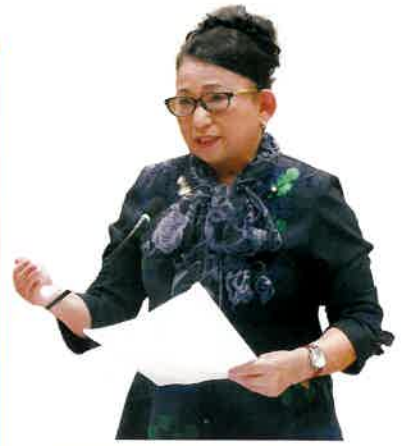
ま え だ え ま 眞 栄 田 絵 麻 議 員