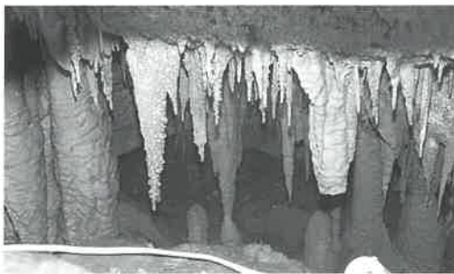
松田鍾乳洞事業導入を!!