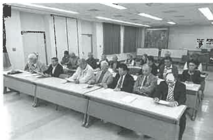
島ぐるみ宜野座メンバー