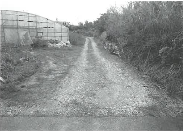
早期の整備を！（農道惣慶17号線）

土地改良事業農道整備は、受益者個々の農地作物を対象とした経済効果（費用対効果）を算出して事業認定を申請する。経済効果が出ない場合は、ヒアリング時点で採択が厳しくなる。粉塵被害や荷傷みなど、農業生産に影響を与え作物に被害を与えている路線を対象に、道路管理計画で事業優先順位に沿って整備を検討中