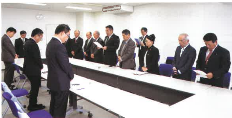
意見書を手渡し抗議する村議会議員

日時：平成30年3月5日（月） 場所：沖縄防衛局 相手方：中嶋浩一郎 沖縄防衛局長