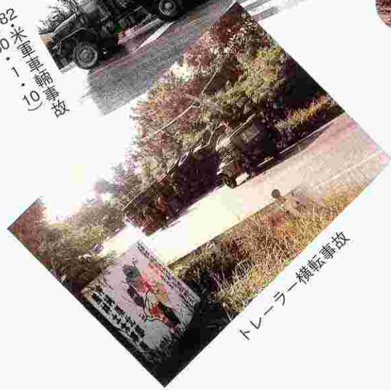
トレーラー横転事故