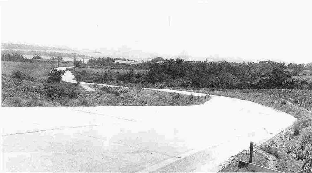
訓練水域と軍用地を結ぶ戦車道（松田区）