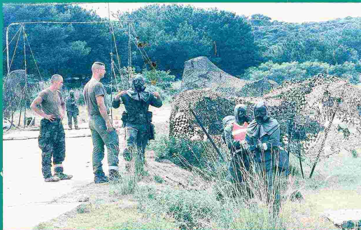
第2訓練場での一般演習（1995年9月27日）