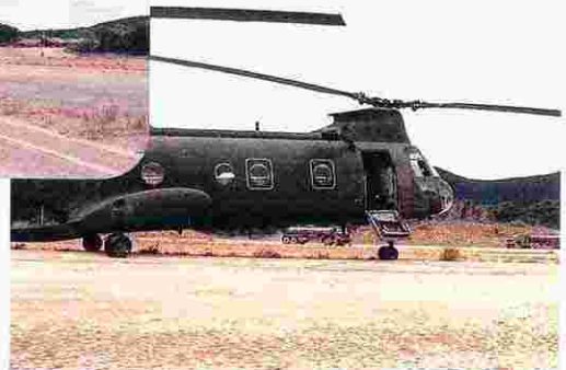
76. パラシュート降下訓練 (S56.2.10)