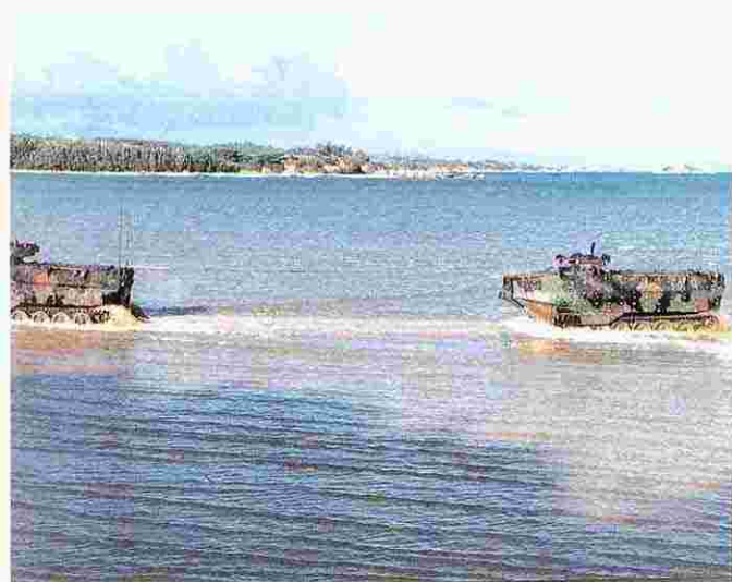
訓練水域 (松田潟原) での水陸両用戦車