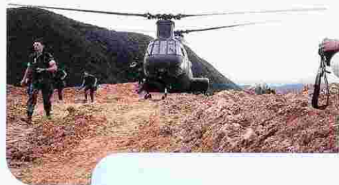
自然破壊 (松田区小岳)