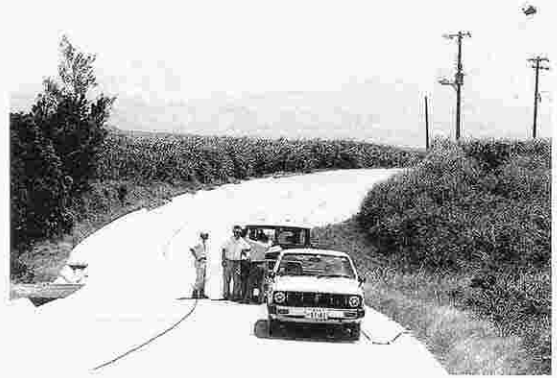
水陸両用戦車の通路（国道↔軍用地）