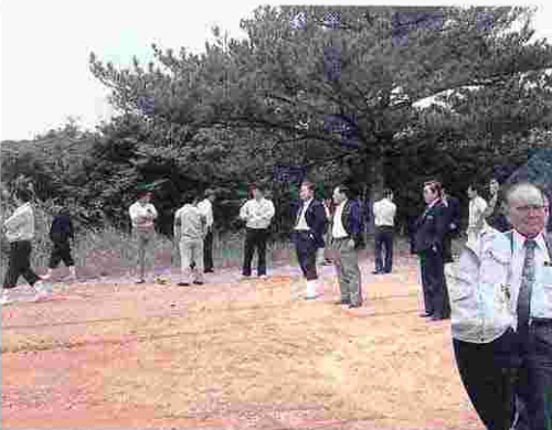
95.都市型訓練施設着工 (H1.6.5)