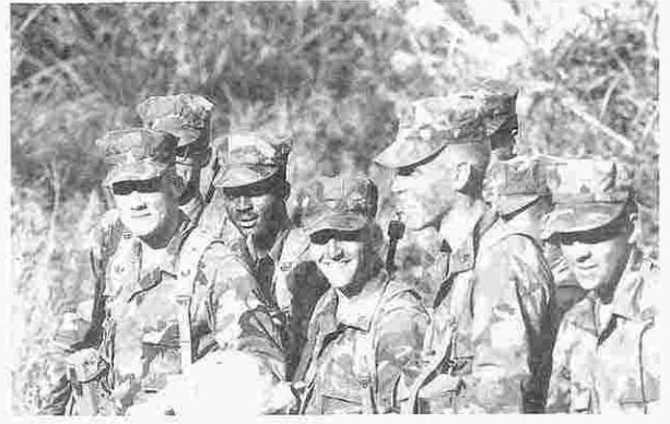
訓練の合い間の米海兵隊員