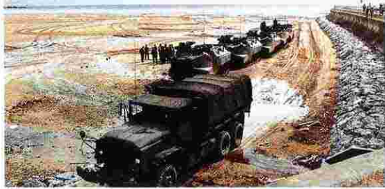
水域から陸上へと国道を横断（S60年）