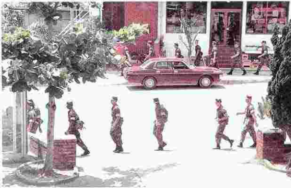
民間地域での行軍 (S57年)