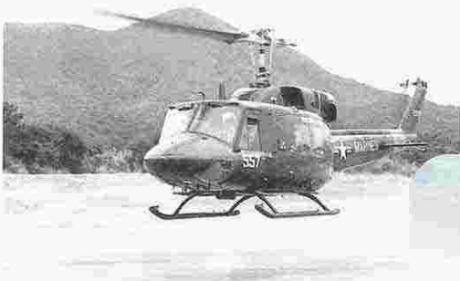
ハリヤー・パッドからヘリ・パッドへ移設