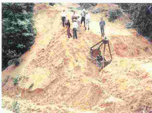
村議会・村当局による立入