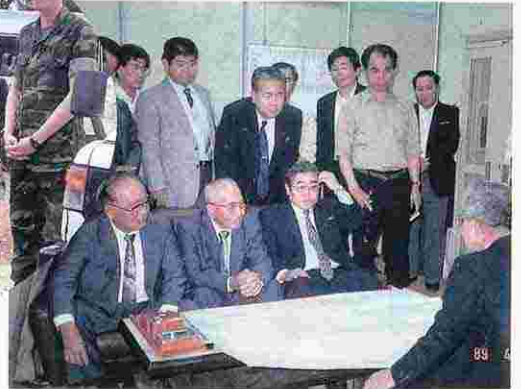
金武防衛施設事務所へ抗議