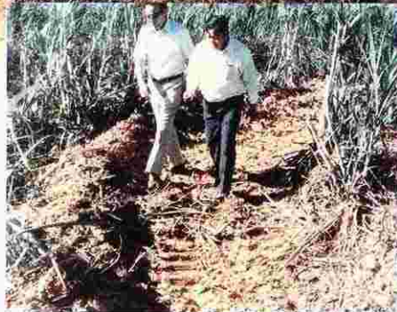
サトウキビ畑を通過