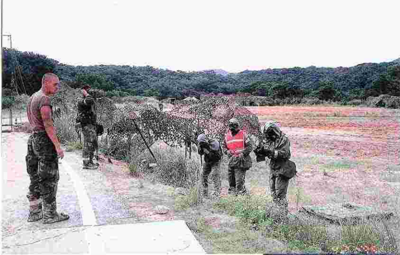
宜野座ダム周辺での一般演習 (H7.9.27)