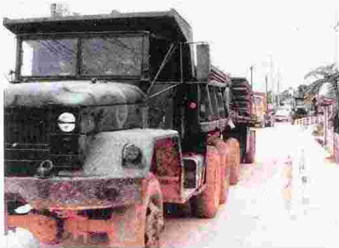
100.車輻による赤土汚染 (福山区進入路) (S60年)