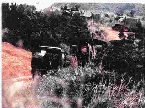
赤土流出問題が台頭