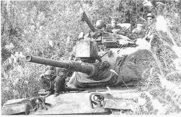
戦闘訓練中の米海兵隊員