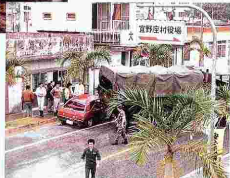
84.米軍車輛（大型）事故 （宜野座区、S60.4.3）