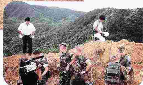
88.ヘリパッド建設 (松田区小岳、S62.6.3))