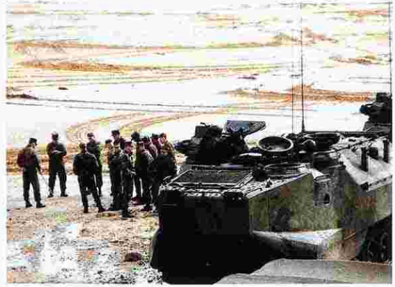
キャンプ・ハンセン水域（松田潟原）