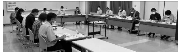
第5次宜野座村総合計画策定庁内会議