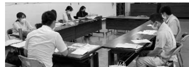
第5次宜野座村総合計画策定検討部会(教育文化部会、保健福祉部会、環境創造部会、産業就労部会、快適環境部会、協働財政部会)