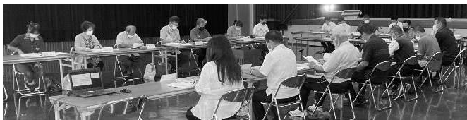
宜野座村総合開発審議会