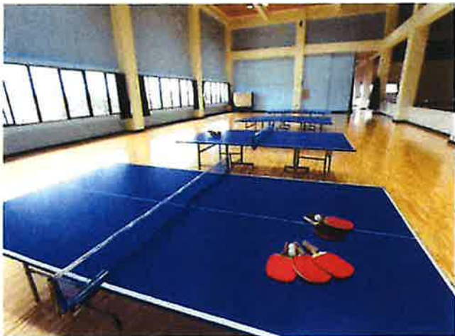
1F/アリーナ・会議室・放送室・談話室・シャワー室・選手控室・休憩室 2F/卓球台(4台)・トレーニング室・ギャラリー・談話室・観覧席

Three basketball courts are available. Audience seats are installed both sides of the courts, and official basketball games are held for elementary, middle school, high school and adults. Not only Okinawa teams, but also teams outside Okinawa use this gym.