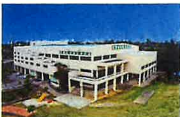
宜野座村総合体育館 / Ginoza Village Comprehensive Gymnasium

予約不要。 空いている器具をご利用ください Reservation not required. Please use open equipment.