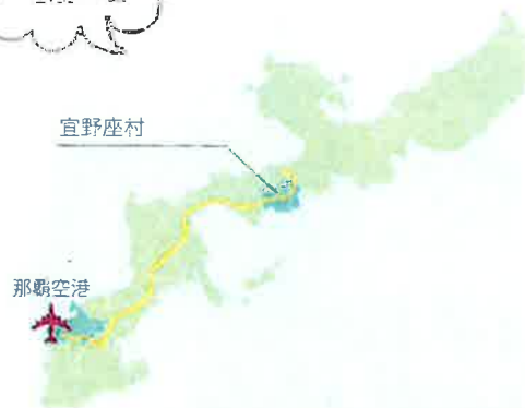
那覇空港→高速北上→宜野座 IC (車で約 50 分)