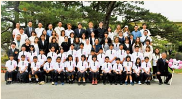
宜野座中学校（1年1組）