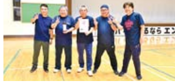
50・60代の部 優勝：40期生