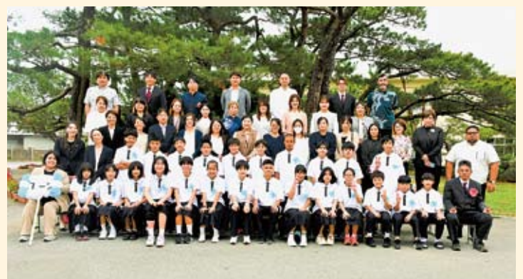
宜野座中学校（1年2組）