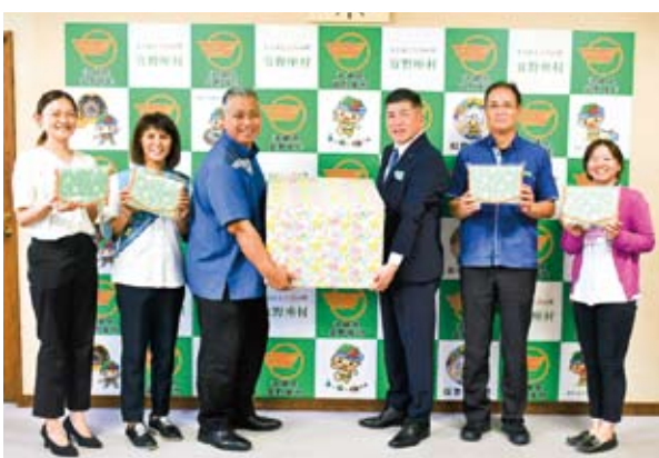
津波古支店長（左から3番目）