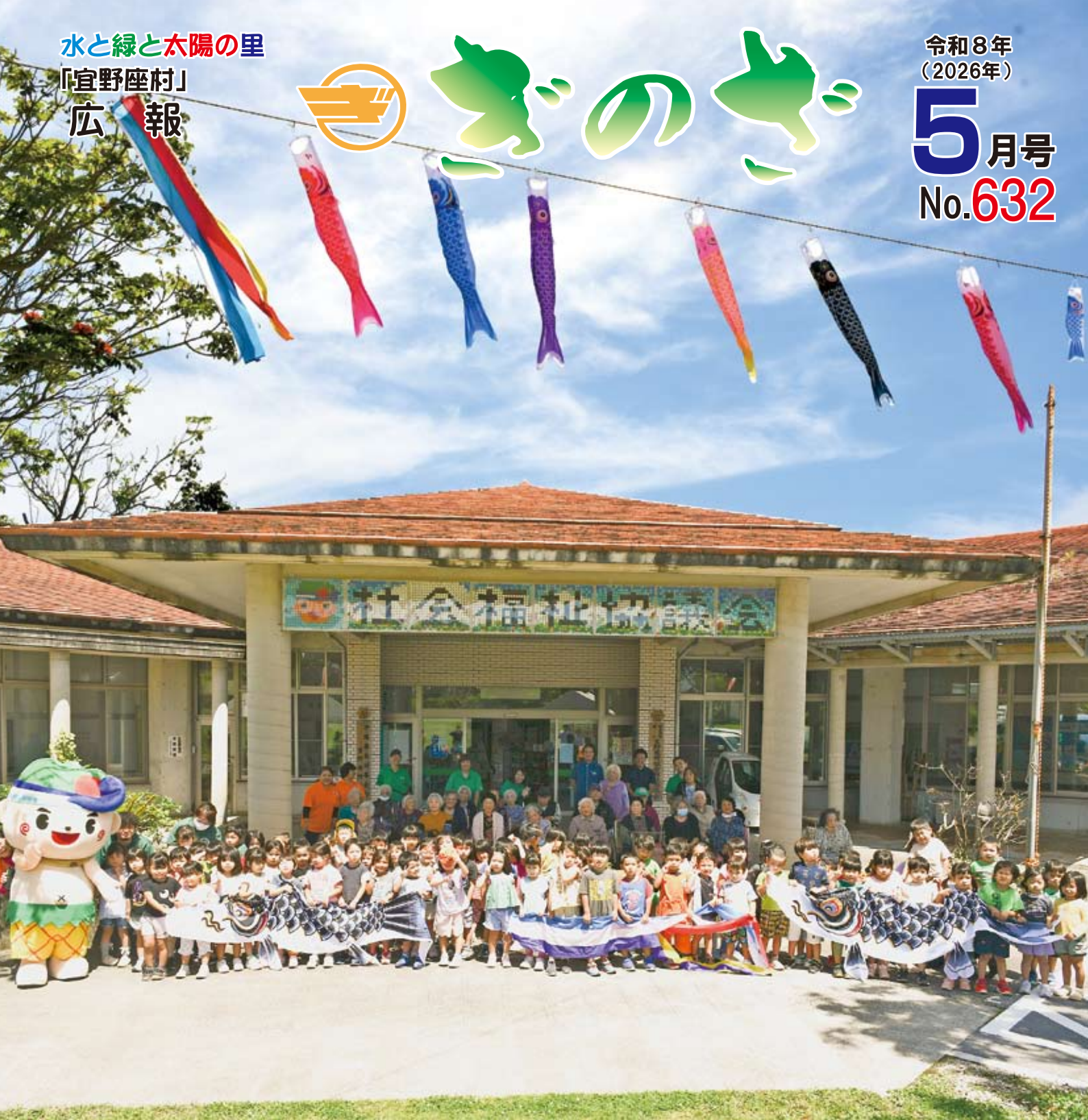
令和8年度 こいのぼり会