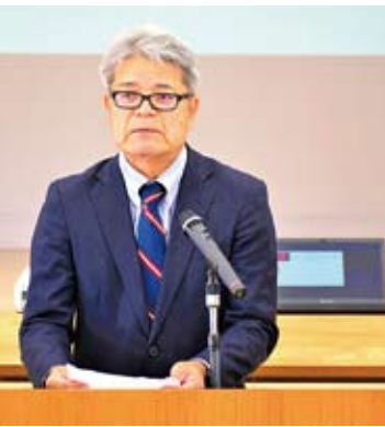
新任教職員代表あいさつ (宜野座中学校 池原校長)