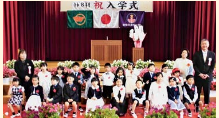
宜野座小学校（1年2組）