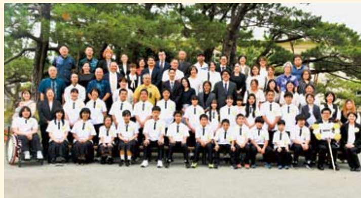
宜野座中学校（1年3組）