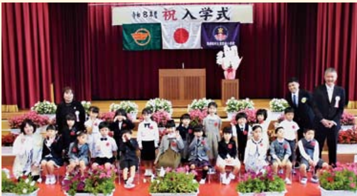
宜野座小学校（1年1組）