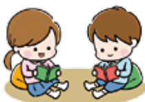
参加者は読み聞かせや人形劇などお話会を楽しみました