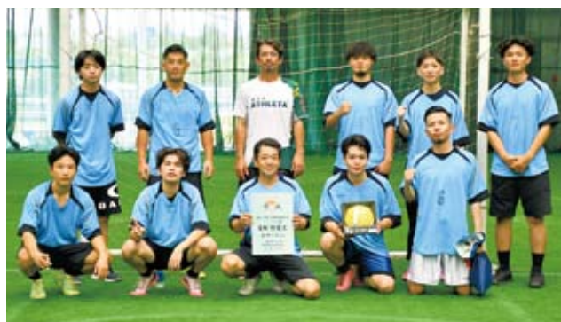
惣慶区 激戦の末4連続優勝を勝ち取りました