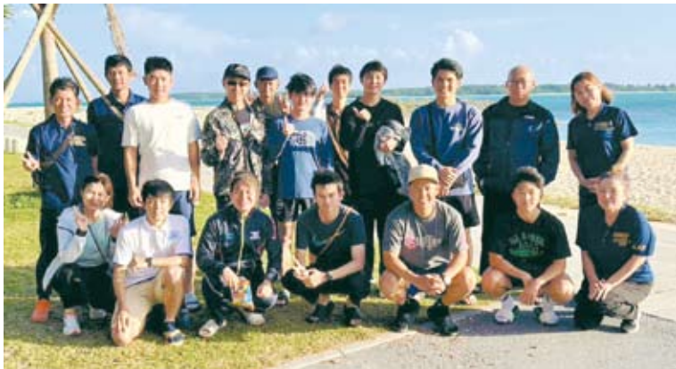
やんばる駅伝参加メンバー お疲れ様でした