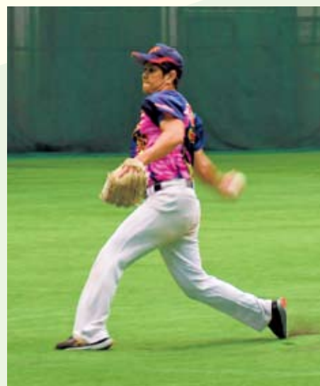
ソフトボールの部