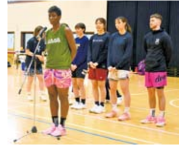
感謝の言葉を述べるエブリン選手