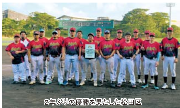
2年ぶりの優勝を果たした松田区