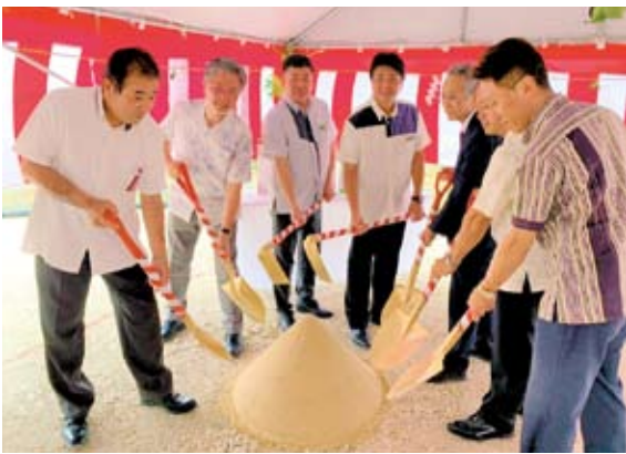
関係者たちによる鉄入れの儀

本整備事業はこれまで外部施設に依頼していた廃棄物焼却後に発生する灰の処理を地区内で行えるようにすることを目的としており、工事完了後は廃棄物処理法により則した処理が行えます。共用開始は令和10年4月を予定しています。