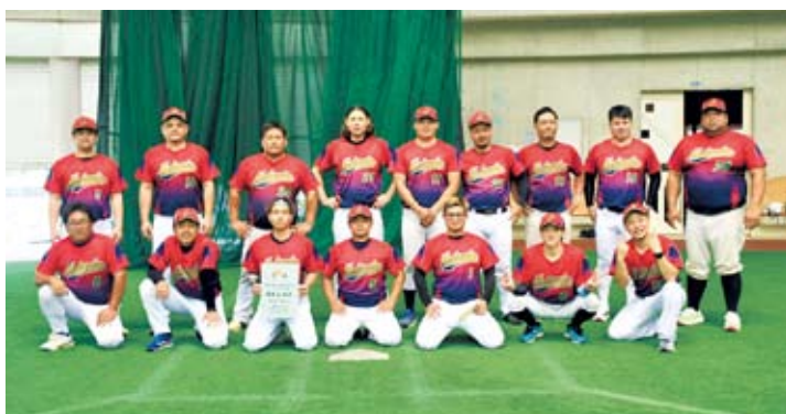
2年連続優勝を果たした松田区

5月10日、第62回村球技格技大会開会式がエントリー宜野座ドームで行われ、ソフトボールの部を皮切りに各種目が始まりました。今月号では、ソフトボールの部、軟式野球の部、フットサルの部、沖縄角力の部の結果をお知らせします。各種目で熱戦が繰り広げられ、7月12日の最終種目まで目が離せません。