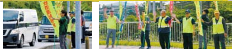
交通安全の呼びかけの様子