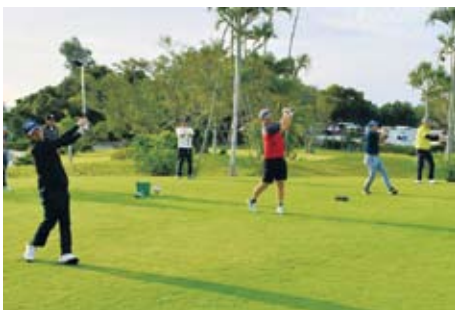
主催者らによる始球式