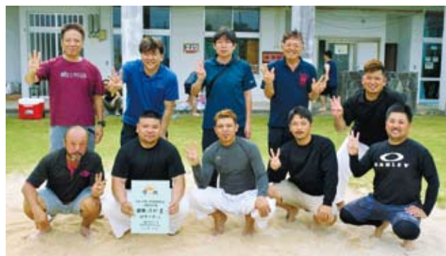
3連続優勝を果たした漢那区