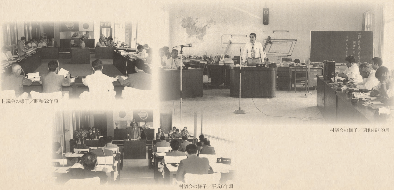
村議会の様子／昭和32年頃