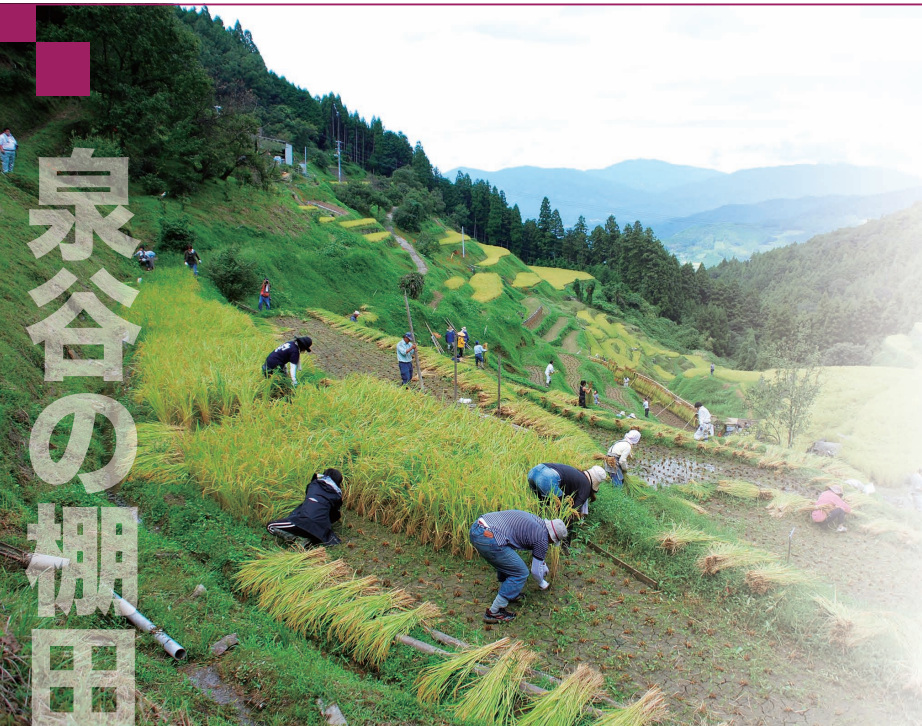
山間の急峻な斜面に95枚の水田が並ぶ泉谷地区。棚田オーナー制度による農作業体験や、地域の自然を満喫する自然浴ツアーなどの体験活動を行いながら、「日本の棚田100選」にも選ばれた美しい風景を守り続けている。