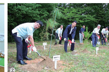
①②兵庫県西脇市の市立農産物直売所「北はりま旬菜館」で、「へそのまち物産フェア」開催。 このフェアは、全国のへそのまちの特産品をお手軽に手に入れられる機会として好評を博しており、全国の加盟8市町村の特産品を販売、村長も参加し記念植樹を行いました。